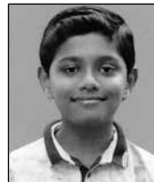
ഹെവിൻ സാം ലിനു